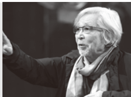
山田洋次監督からのメッセージ

新しい物語を生み出すこととなった。古典落語「妾馬」が題材だが、この「一万石の恋」では落語とは真逆の結末が待っていて、愛する人のためには命を投げ出す覚悟の乙女の宣言に、愚かな殿様やアホな家臣たち、そして無責任な長屋の住人たちが、ドタバタ騒ぎを演じることになる。 長屋の井戸端で交わされる可笑しな会話や、恋人同士の甘いラブシーンに、胸をワクワクさせてほしい。そして、マスクの下から思わず漏れる笑い声で会場が満たされることを期待して、前進座の皆さんと一緒に汗をかこうと思う。