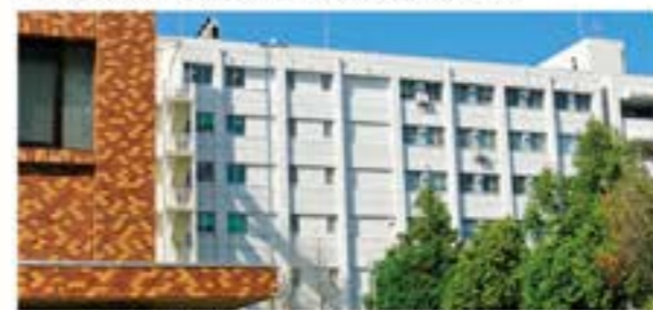
富山大学和漢医薬学総合研究所(杉谷キャンパス)

富山大学は、医学、薬学部など9学部、和漢医薬学総合研究所や大学附属病院を擁する、日本海側有数の基幹的な総合大学です。令和4年度から大学院に「医薬理工学環」を新設する等、幅広い分野の専門家の養成にも取り組んでいます。