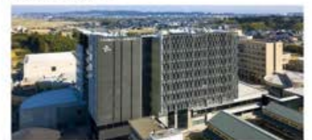
富山県立大学(射水キャンパス)

富山県立大学は、平成29年4月に全国で初めて医薬品工学科を設置し、医薬品産業を工学の観点から支える人材育成に取り組んでいます。また、生物工学科ではバイオ等の教育研究体制の強化も行っていきます。