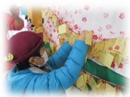
咲かせよう!おがいの花