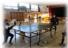
帰ってきた!卓球タイム

3月15日(月)～3月19日(金)までにわくわく4階放課後ルームにて申し込んでください!!