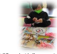
紙皿で装飾を作ろう!