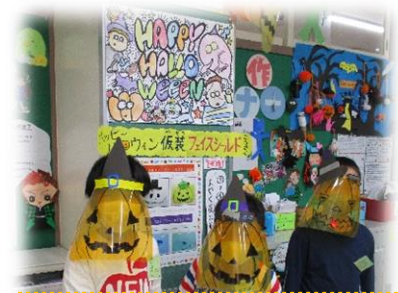
トリックオアトリート