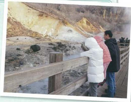
登別の地獄谷にて (本編とは関係ありません)

この原稿を書いているころは忘年会シーズンで、飲むことを完全に止めることは難しいのですが、「週2回以上の休肝日」の達成を目標にして、これからはもう少し健康に気を遣いたいと思います。