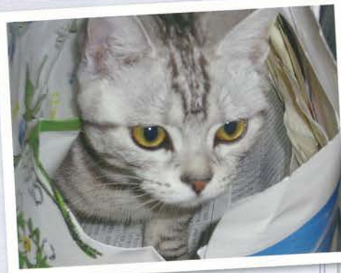
写真は本文とは関係ありません。うちの飼い猫（くうちゃん）です。

相次いで二つの巨星失い、じん肺被害救済・じん肺根絶のたたかいは大きな打撃を受けることになった。しかし、亡くなった人は帰ってこないし、じん肺をめぐるたたかいは、日々新しい局面を迎えている。結局、遺された私たちが、巨星の遺志を引き継いでやり遂げるしかない。それが歴史というものだと実感する日々である。