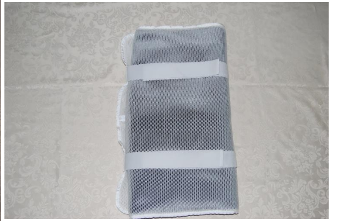
裾を 10cm ほど折り、それを二つ折にして留める