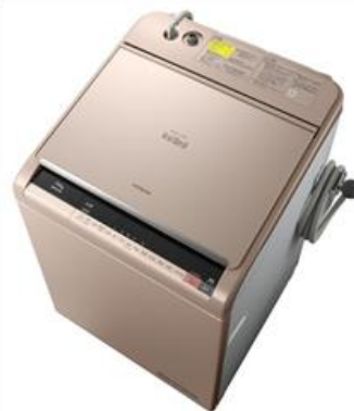
推奨 日立ビートウォッシュ 11kg 洗い BW-DX110A

上画像の混合栓で接続されていればぬるま湯の供給が可能。管理用品：水温計&タイマー