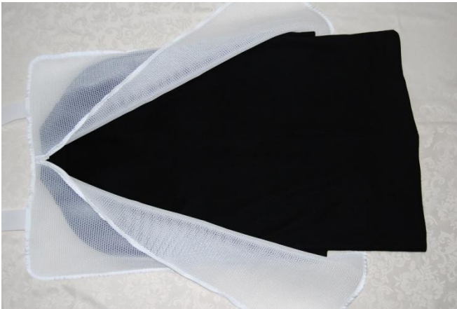
コート ボタンを留め前身頃を下にして仕込む