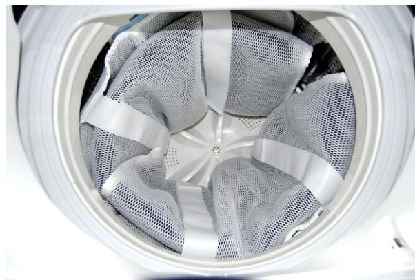
2~3点の場合は、平置きで洗濯して襟を上部に均等に配置して脱水