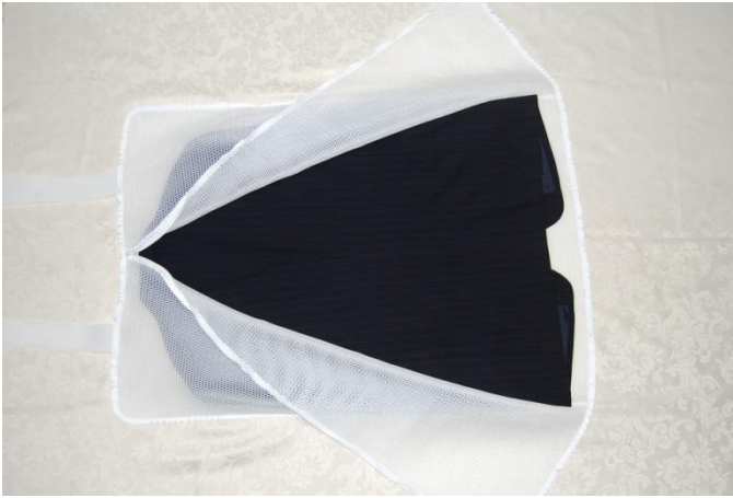
スーツ ボタンを留め前身頃を下にして上着を仕込む

※ 説明のため色違いの上着/ズボンを使用しておりますが、実際には同色系で仕込み洗淨ください