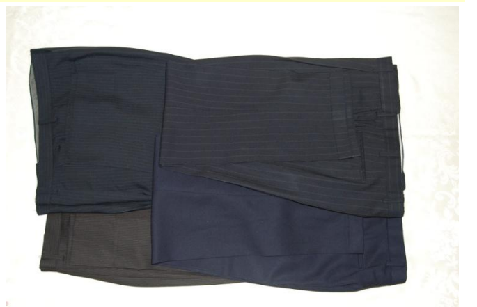
スポンのみ 互い合わせに 4 本配置し、二つ折り