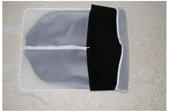
裾を 10cm ほど折り、それを二つ折にして留める