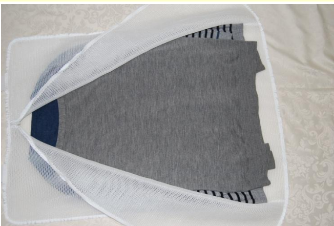
セーター・カーディガン等 同色系で仕込む 5~6 枚