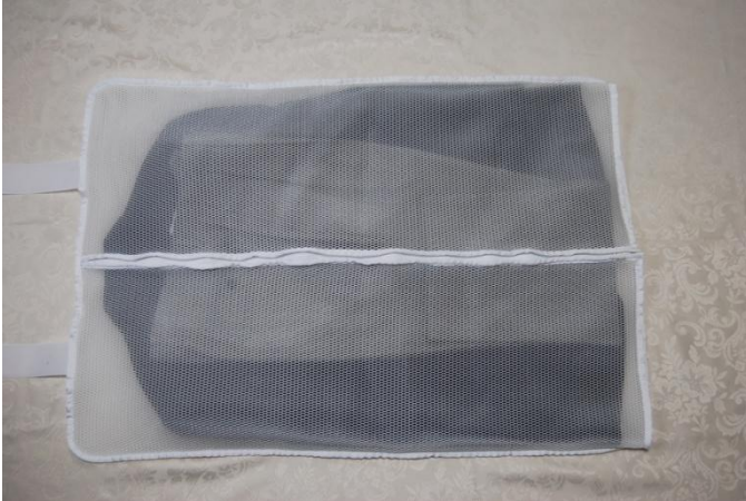
ファスナーを閉じる