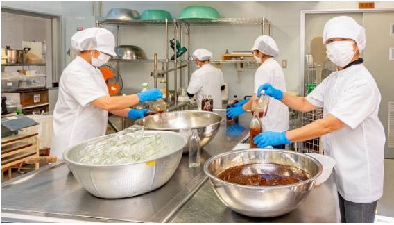
喜界町農産物加工センター