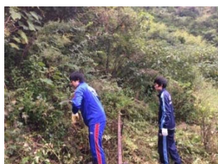
耕作放棄地の再生