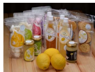
開発したレモン加工品