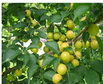
収穫直前の「七折小梅」