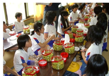
地元小学生のうめ漬け体験教室