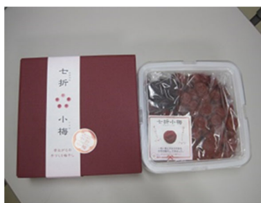
「七折小梅」の梅干し