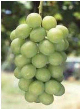
シャインマスカット