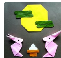
『おつきみだんご会』